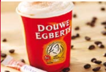
De hele dag door genieten